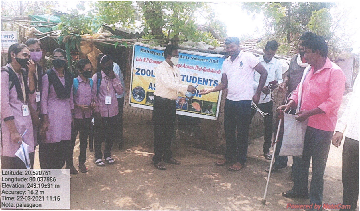
Faculty and Students spreading awareness about use of Hand Sanitizer