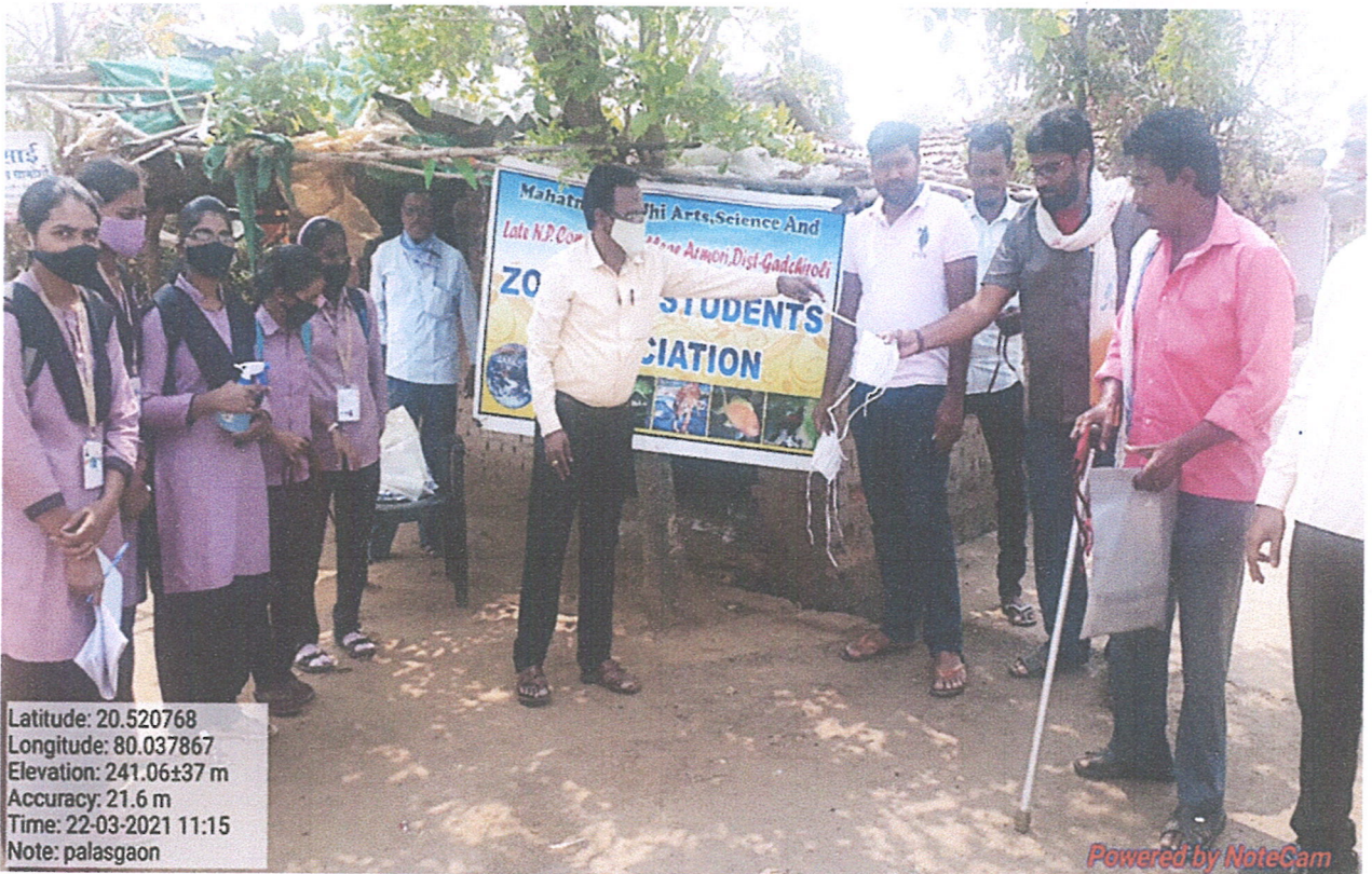
Faculty and students distributing mask to villagers